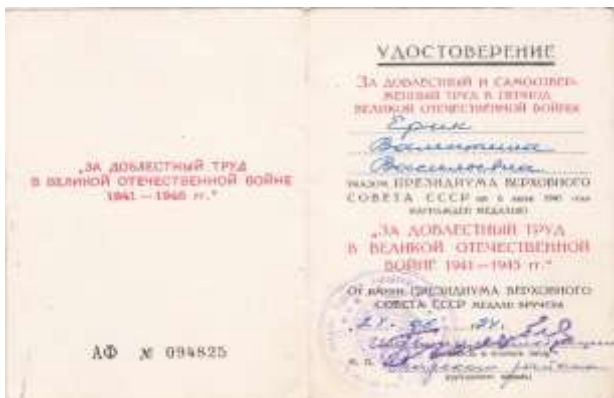
Удостоверение на медаль Ерик В.В.

Таким образом, занимаясь изучением данной темы, я получила ответы на многие интересующие меня вопросы. Я узнала, что моя прабабушка была не только труженицей тыла во время Великой Отечественной войны, но и в мирное время. Это доказывают её награды. Свою работу я строила на основе документов, воспоминаний и бесед. По возможности я собирала фотографии.