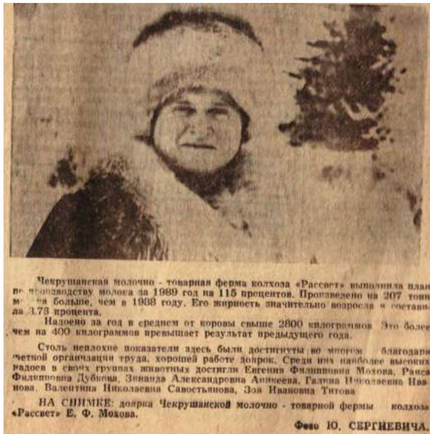
Материалы газеты «Ленинский Путь» 18 октября 1986 года №186, 19 января 1990 года №10