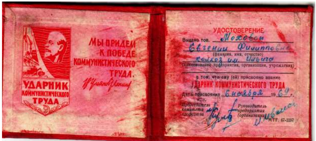
Удостоверение «Ударник коммунистического труда» 1969 год