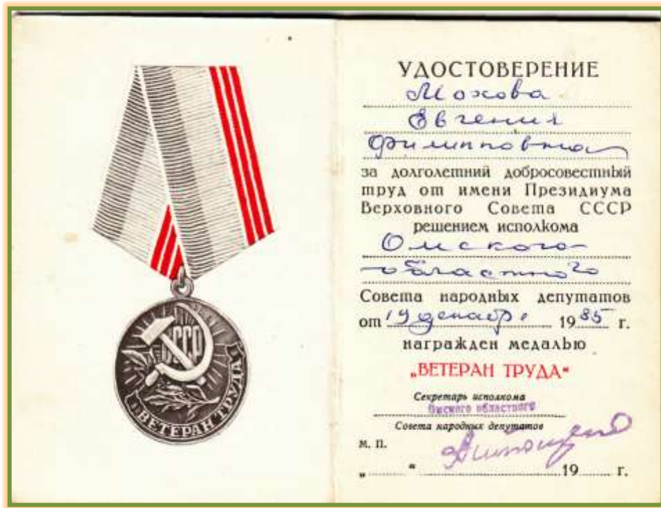
Удостоверение к медали «Ветеран труда» 1985год